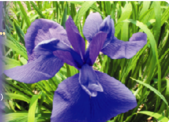
市の花「ハナショウブ」 (平成23年2月21日 発行)

堺市公園愛護会 事務局／財団法人 堺市公園協会 〒590-0803 堺市堺区東上野芝町1丁4番地3（花と緑の交流館2階） TEL072(245)0070 FAX072(245)0069 e-mail:sakai-pa@siren.ocn.ne.jp