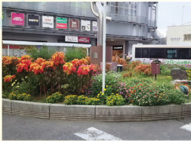
三国ヶ丘駅前花壇 (堺区)