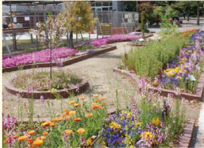
大仙圃場前花壇 (堺区)