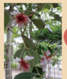
フェイジョア など