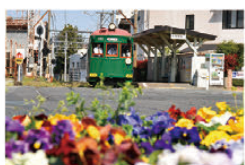
特別賞(堺堺線全線開通110年記念賞) 「レトロな街並み」阪本 浩志 堺区 緑之町