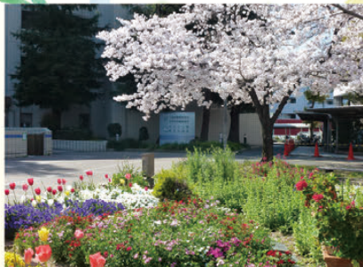
中区役所前コミュニティガーデン (中区)