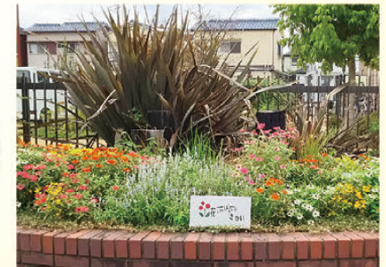
とみおかフラワーガーデン (東区)