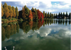
準グランプリ 「鏡池」河村 雄 中区 薮池