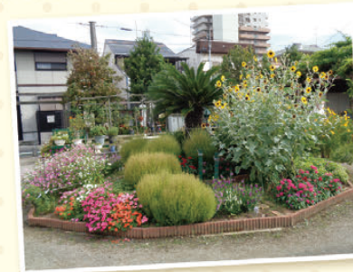
【場所 錦西花と緑の広場(堺区)】