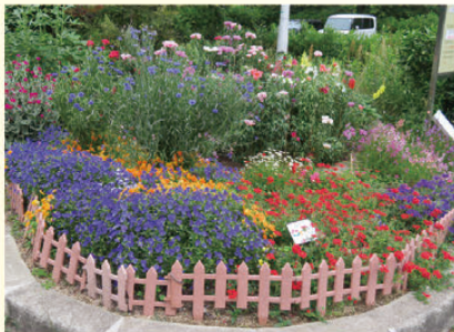
荒山圃場前花壇 (南区)