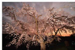
特別賞(審査員特別賞) 「妖艶な滝桜」新見 文彦 南区 御池台1丁