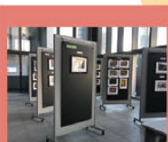
堺市役所本館1階 入賞作品24作品を展示しました