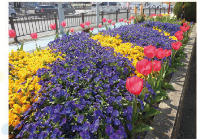
北堺警察署前花壇 (北区)

花のボランティアと一緒に活動しませんか。 問い合わせは(公財)堺市公園協会まで。