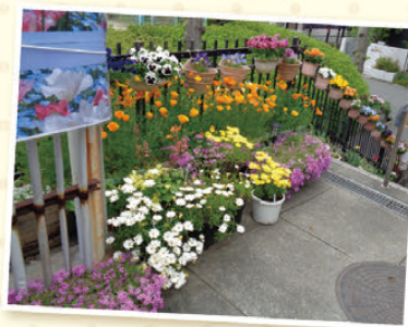
【場所 赤坂台5丁目自治会集会所(南区)】