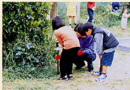
▲樹名札の取り付け