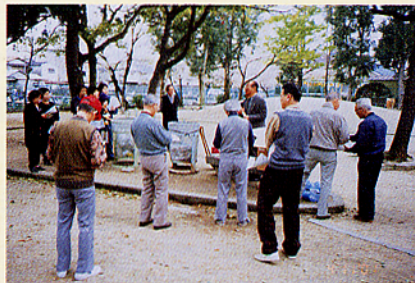
▲みどりと遊ぶミニ講習会

公園や緑を慈しむ心を育み、より公園に親しんでいただくために公園の樹木に樹名札を取り付ける運動を平成6年度から行っています。現在まで市内各所40公園に取り付けています。平成11年度は三国ヶ丘地区、土師地区で行いました。両地区とも愛護会運営委員並びに愛護委員を主体に自治会及び子ども会の参加を得て、晴天のなか実施されました。