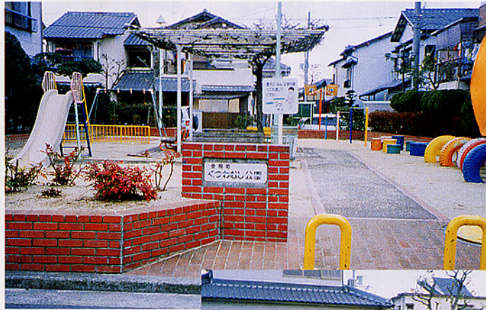
▲金岡町 くつわむし公園

私たちは公園愛護会が「親睦の場」となることが一番の希望であり、公園を通じてこれからも継続させていくために毎月第2日曜日がありますので、現在参加されている方々をはじめ、他の皆様も地域的なコミュニケーションを深めるとい意味も込めて、積極的に参加していただきたいと切望しています。