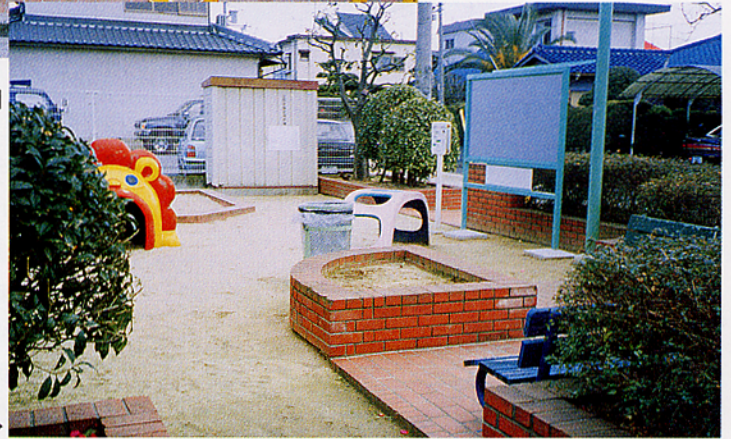
金岡町 つくみ公園▶