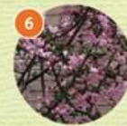
6 ハナカイドウ(落葉中木)