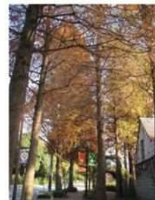
秋のフレンドシップアベニュー

センターの入り口前にあったセンベルセコイアも倒木のため、すぐに伐採されました。センターが開設された当初からあった樹齢35年以上、高さ約15mの大きな木で、フレンドシップアベニュー(センター前街路樹)の四季を彩るシンボルツリーでした。