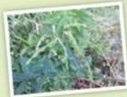
アレチヌスビトハギ (荒地盗人萩) マメ科 ヌスビトハギ属 多年草 学名: Desmodium paniculatum

背丈は100cm程になり、葉には細かい毛がある。花期は7-9月にピンク色に色づく。その表面は触れるとざらつくが、これは細かな鉤(かぎ)が並んでいるため、これによって衣服などによくくっついてくる。言わばマジックテープ式のひっつき虫である。