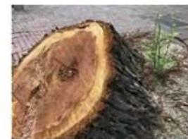
伐採6日後のセンベルセコイア