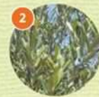
2 オリーブ(常緑高木)