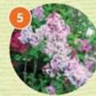
5 ライラック(落葉低木)