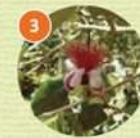
3 フェイジョア(常緑中木)