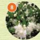
8 ギンバイカ(常緑低木)

問い合わせ先 公益財団法人 堺市公園協会 TEL 072-245-0070 メール sakai-pa@siren.ocn.ne.jp