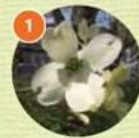
1 ハナミズキ(落葉高木)