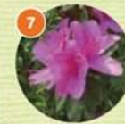
7 ヒラドツツジ(常緑低木)