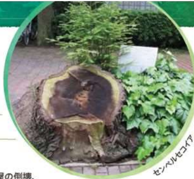
センベルセコイア

昨年(2018年)9月4日、大阪を台風21号が襲い、堺市でも家屋の倒壊、一部損壊や停電など各地で大きな被害がありました。公園の被害も甚大で、特に樹木の倒木、傾木、折れ枝など、その数12,000本。伐り出された丸太の山が被害の大きさを物語っております。