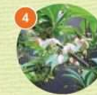
4 エゴノキ(落葉高木)