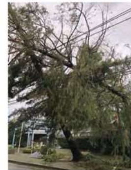
台風直後のセンベルセコイア

まだまだ台風の片付けが終わらない頃、伐り出された切株からはひこばえが生えていました。右の写真は、伐採から6日後に撮影されたものですが、樹の生命力に驚かされます。堺市内の公園でも台風で倒木し伐採された切株から、同様のひこばえが見られました。公園の切株は管理上、整理されますが、センターでは、一部、台風の被害、樹木の生命力を広く伝えるため、保存しています。大きな台風が堺を直撃し甚大な被害があったことを後世に伝えるとともに、樹木の生命力を学びたいものです。