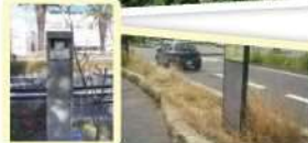
活動を始める前の状態