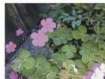
オキザリスボーウィー