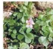
ムラサキカタバミ