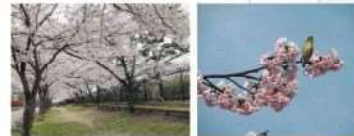
履中天皇陵古墳のソメイヨシノ 平成の森のオオカンザクラ

南東入口付近のオオカンザクラは3月中旬から咲きはじり、大仙公園の桜の季節が始まったことを教えてくれるようです。