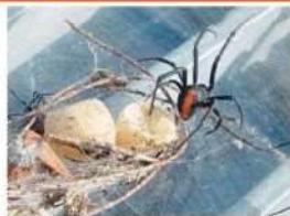
落ち葉がからまった巣(メス)