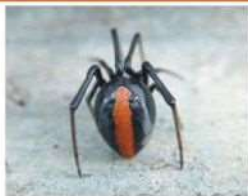
黒に赤色の模様が特長(メス)

巣は粘り気が強くしっかりとした糸を張るため、たくさんの落ち葉などがからまっています。比較的低い位置への営巣が多く見られます。