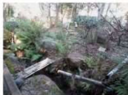
せせらぎのある里山の庭