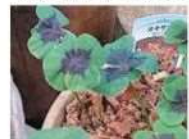
四つ葉のカタバミ(オキザリス・デッケイ)

です。またクローバー同様カタバミにも四つ葉がありますが、天然ではクローバーよりはるかに出現率が低いようです。