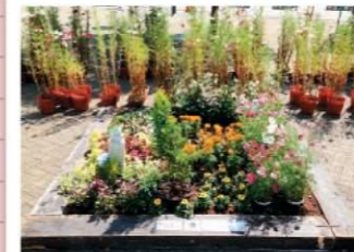
古代人から現代人へのメッセージ みなみ花咲くまちづくり推進協議会