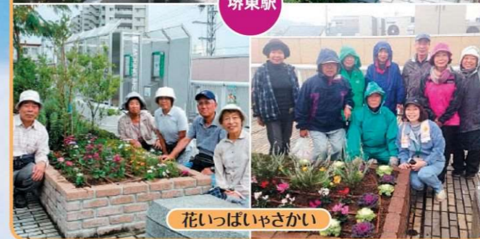
花いっぱいさかい