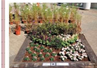
みんなで手をつなごう 生活リハビリテーションセンター