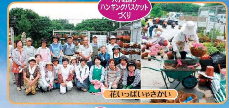
大小路通り ハンギングバスケット づくり