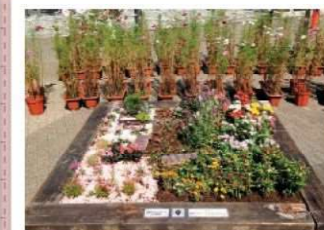
季節のうつろい 錦西グラウンドワーク実行委員会