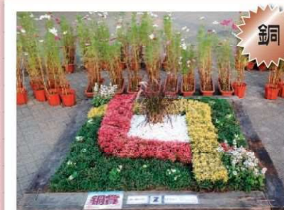
手と手をつなごう 花いっぱいさかい