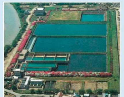
昭和50年ごろの浅香山浄水場