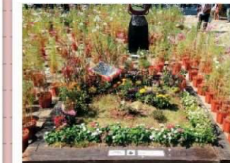
地域のつながり 秋まつり 八田荘西校区 鈴の宮 緑の会