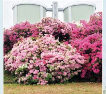
現在の浅香山配水場