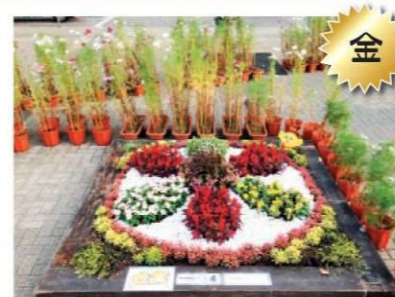
花と緑でつながる友の会 堺市都市緑化センター 友の会