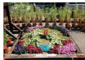
つながるー地域との共生 堺・泉北臨海企業連絡会