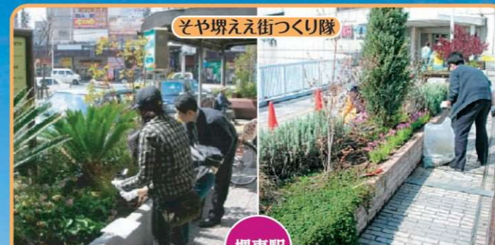
そや堺ええ街づくり隊

「この花はどこに植える?」「センスが問われるなあ〜!」堺市内のさまざまな箇所では市民協働による緑化活動が行われています。明るくいいきと活動される姿をご紹介します。