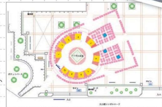
前方後円墳をイメージして配置