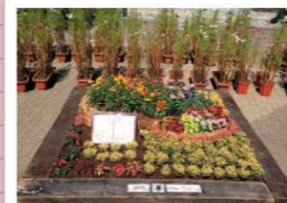
はじまりはひとつぶの種から いろいろの公園をめざす会