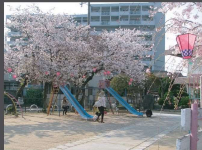
北区 黒土町ちびっこ老人憩いの広場