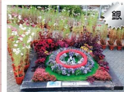
一致団結!サムライ魂 修成建設専門学校