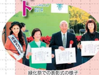
緑化祭での表彰式の様子