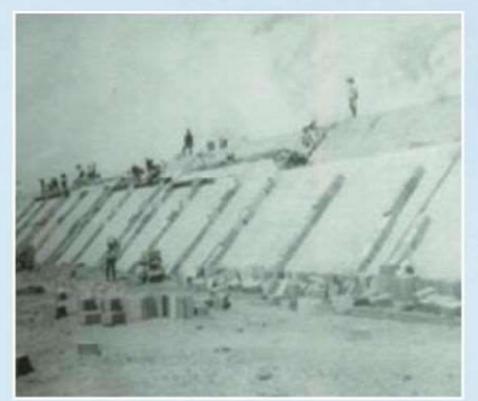
浅香山浄水場沈でん池築造工事(明治42年ごろ)

今年も浅香山つつじまつりが開催されます。激動の時代を守り育てられ受け継が れてきた浅香山のつつじをぜひご覧ください。 ※現在浄水場としての機能はなく、高架配水池2池と地下1池を備えた配水場とな っています。