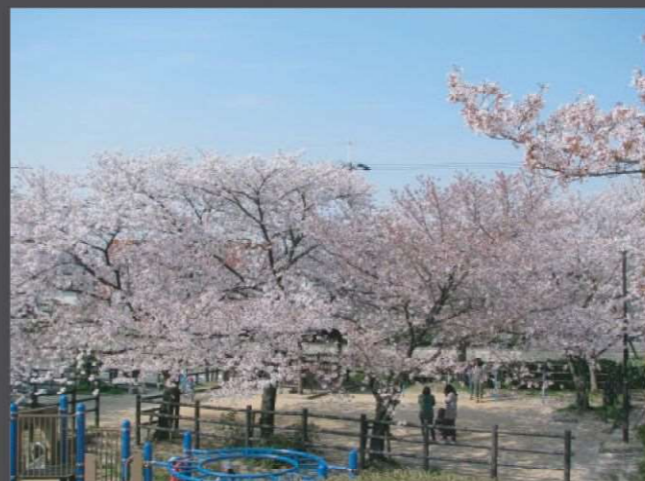
美原区 さくら公園