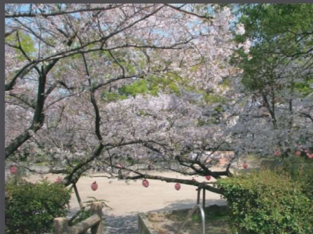
堺区 向泉寺公園(榎元町)