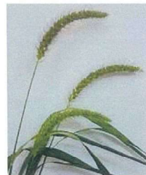
アキノエノコログサ

草花の名前には、必ず理由があります。このエノコログサ、先の穂が子犬の尻尾みたいに見えませんか。だから「犬ころ草」・・・イヌコログサ・・・エノコログサと変化。英語では Foxtail grass・・・キツネのしっぽの草と呼ばれています。