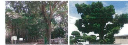
野々宮神社のトコハカの森