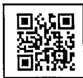
「みんなの公園愛護会」