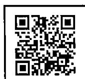
「堺市公園協会愛護会」

— 問合せ先 — （公財）堺市公園協会 愛護会グループ 担当：鈴木・山本・松本 TEL：072-245-0070