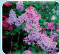
⑥ライラック(モクセイ科/落葉中木)

果実はオリーブ油の原料となります。小枝が平和の象徴とされることで有名です。※1本だけでは実はなりません。