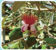
④フェイジョア(フトモモ科/常緑中木)