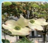
①ハナミズキ(ミズキ科/落葉高木)

①～⑥：樹高約100cm ⑦：樹高約40cm / ①～⑦は配付本数が1本、 ⑧：樹高約40cm / ⑧は配付本数が1～3本まで選べます。