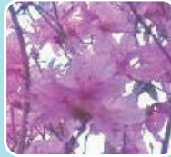
⑦ミツバツツジ(ツツジ科/落葉低木)

初夏に花が釣り下がり咲くので、欧米ではスノードロップツリーと呼ばれています。樹形が美しいので、庭木やシンボルツリーに人気です。