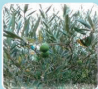
②オリーブ(モクセイ科/常緑高木)

桜のような花をたわわに咲かせます。花の美しさから、中国では美人(楊貴妃)の代名詞として使われています。