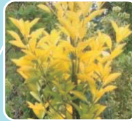
⑧オウゴンマサキ(ニシキギ科/常緑低木)