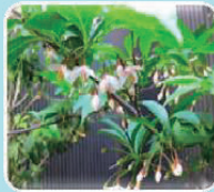
③エゴノキ(エゴノキ科/落葉高木)

フランス名はリラとよび、香水やアロマオイルの原料になります。5～6月頃に白やピンクなどの香りの良い花を咲かせます。