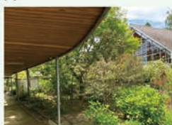
里山の庭(ホテル水路側)