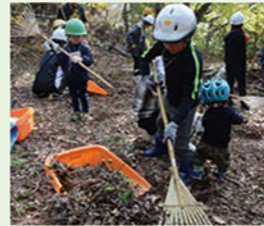
堺の森 再生プロジェクト

ふるさとに残された里山の緑やまちの緑を未来の子ども達に守り残していくために、緑の保全活動を推進しています。緑豊かでうらおいのある堺のまちづくりをめざし、緑の保全活動に必要な支援を行うとともに、市民や事業者、活動者と協力して、緑を保全するために行う事業に取組みます。ふるさとの緑を次世代に残すため、皆様のご協力をお願いいたします。