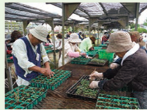
花のボランティア活動支援事業