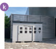
堺市災害用備蓄倉庫