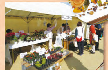
※写真は令和4年度のものです