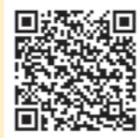
堺市はなみどり基金 QRコードについて

堺市では、令和2年10月に「堺市都市緑化基金」と「堺市緑の保全基金」を統合し、「堺市はなみどり基金」を新設しました。市民の皆様と、企業・団体等の寄附金及び市の積立金を合わせた、この「堺市はなみどり基金」を使い、都市緑化事業や緑の保全事業を進めています。