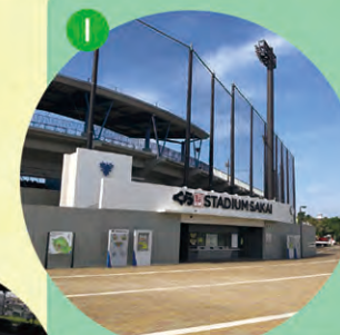
くら寿司スタジアム堺