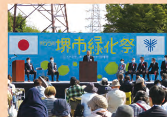
緑化功労者表彰式典の様子