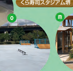
原池スケートボードパーク